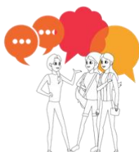
Rozmowa z innymi